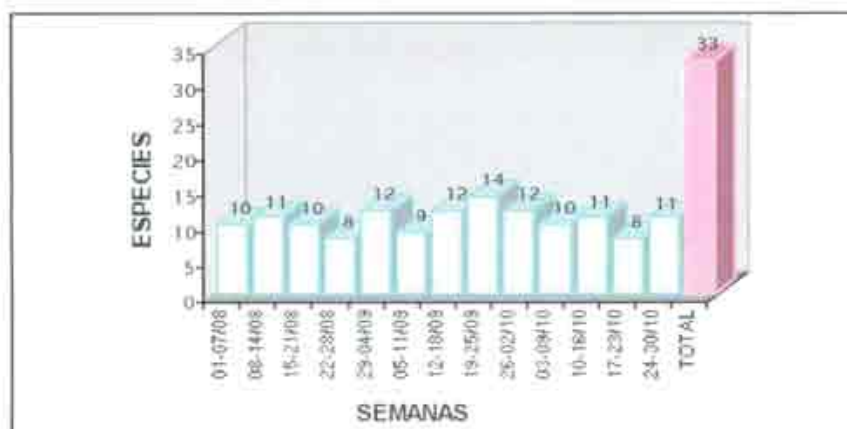
Figura 5. Número de especies diferentes (riqueza) en cada periodo semanal y total.

La especie más capturada fue el Carricero Común ( Acrocephalus scirpaceus ) en 493 ocasiones (40.81%), seguida del Mosquitero Musical ( Phylloscopus trochilus ) con 338 capturas (27.98%).