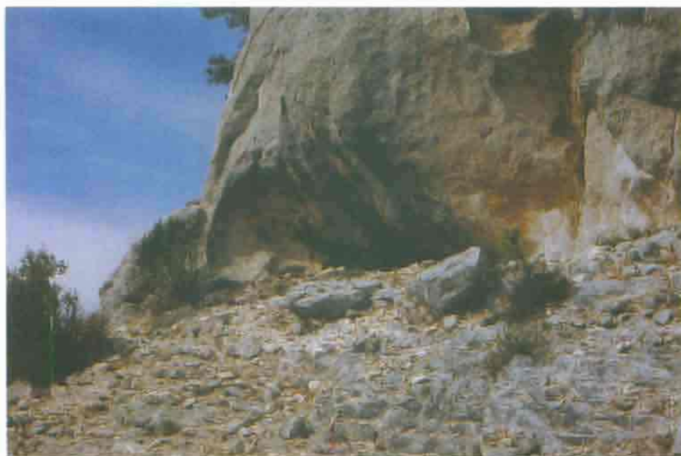
Figura 17. Vista general del abrigo de Arroyo Blanco II.