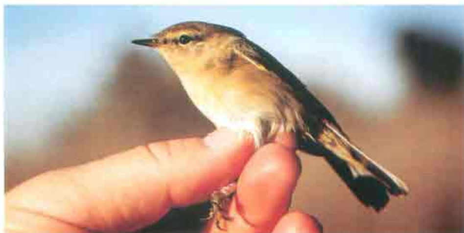
Figura 40. Mosquitero Común ( Phylloscopus collybita ).

Las características biométricas apreciadas para esta especie fueron: Ala (jóvenes) 50-64.5 mm, media 57.22 (n=27); (adultos)= 55-64 mm, media 60.40 (n=5). Tarso (jóvenes)= 17.6-20.7 mm, media 18.79 (n=27); (adultos)= 18.2-20.1 mm, media 19.16 (n=5). Peso (jóvenes)= 6.5-10.5 grms, media 8.18 (n=27); (adultos)= 7.5-9 grms, media 8.10 (n=5). Grasa : (jóvenes)= 3-5, media 3.74, moda 4 (n=27); (adultos)= 3-5, media 3.80, moda 3 y 4 (n=5).