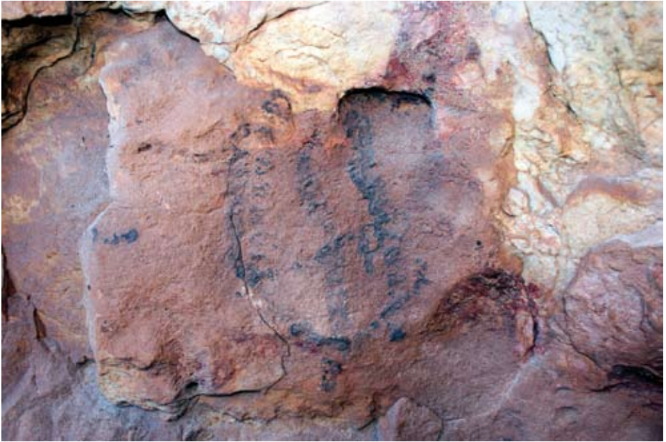
Figura 17. Abrigo del Cornibelete I. Panel 4. Signo número 11.