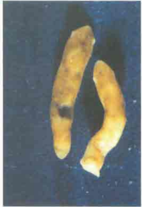
Foto 10: Dugesia sp. (se observan perfectamente las manchas oculares. Tamaño aproximado 12 mm.).