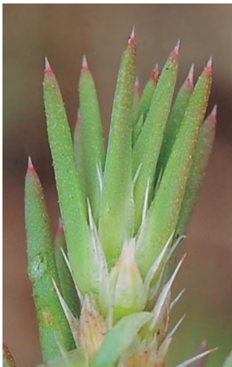
Figura 23. Polycnemum majus . Detalle del extremo de una rama.