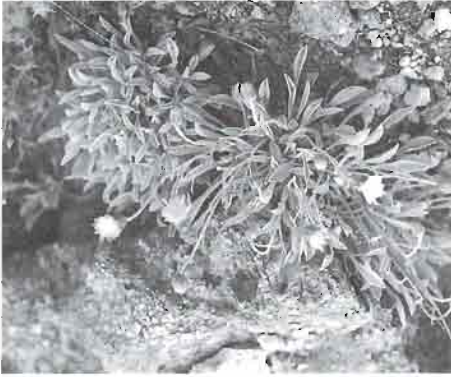
Foto 1. Andryala agardhii .