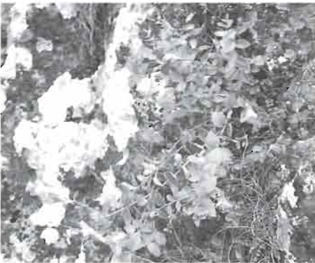
Foto 3. Linaria cavanillesii .