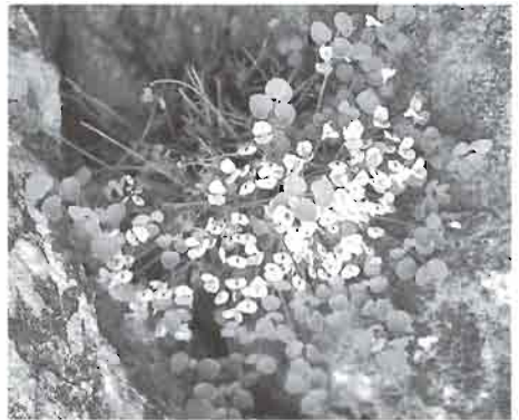
Foto 4. Sarcocapnos baetica ssp. baetica .