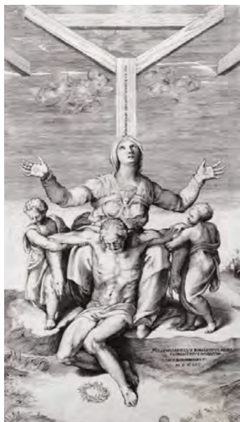
Fig. 6. Grabado de la Piedad de Colonna. Año 1546. The British Museum. Londres. Autor: Julio Bonasone.