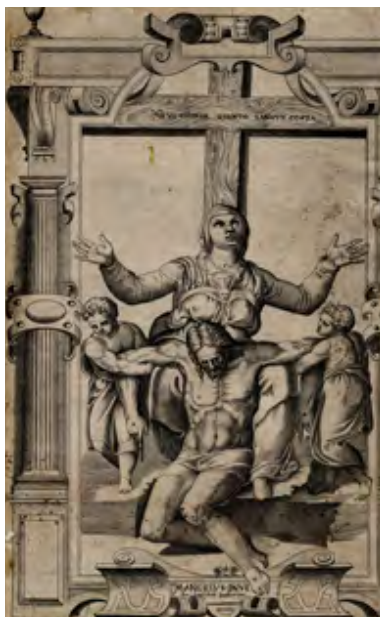
Fig. 8. Grabado de la Piedad de Colonna. Año 1560. Academia de Bellas Artes de San Fernando. Autor: Giovan Battista Cavaliere.