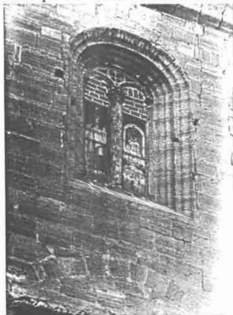
Figura 2.- Ventana. San Blas. Villarrobledo.

Respecto a cubiertas góticas nervadas en el cuerpo principal, la más completa de estas iglesias es la de Hellín, pero sus bóvedas son de gran sencillez: de crucería en las naves laterales y con terceletes, ligazones y espinazos en la central; la capilla mayor de esta iglesia de cinco paramentos, tiene bóveda semejante a la de San Juan de Albacete, igualmente de cinco paramentos. Por el contrario, en los primeros tramos de las tres na-