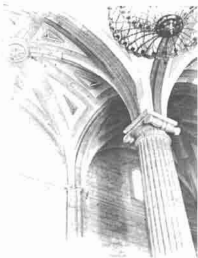
Figura 6.- Interior. S. Juan Bautista. Albacete.

Bóvedas y arcos se levantan sobre pilares. Es en éstos donde quizá se observa mejor la evolución del gótico al renacimiento, hasta llegar a convertirlos en verdaderas columnas de orden clásico, como en Albacete (figu-