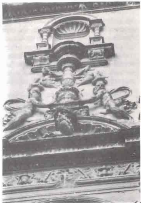
Fig. 7.- Santa María de Chinchilla. Exterior. Detalle del lienzo central del ábside.