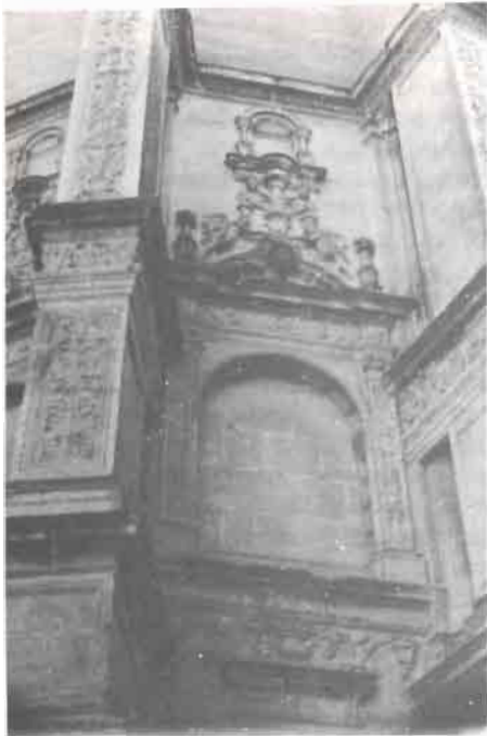
Fig. 6.- Santa María de Chinchilla. Segundo templete ciego exterior (lado epístola)