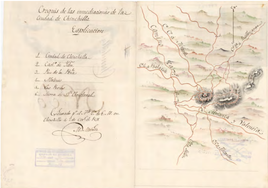
Figura 9.- Croquis de Chinchilla donde se aprecia su posición dominante sobre el Camino Real de Madrid a Valencia y su entorno, dibujado por Manuel Muñoz, Ayte. 2º de E.M. 1811. Centro Cartográfico del Ejército, Hoja 186.