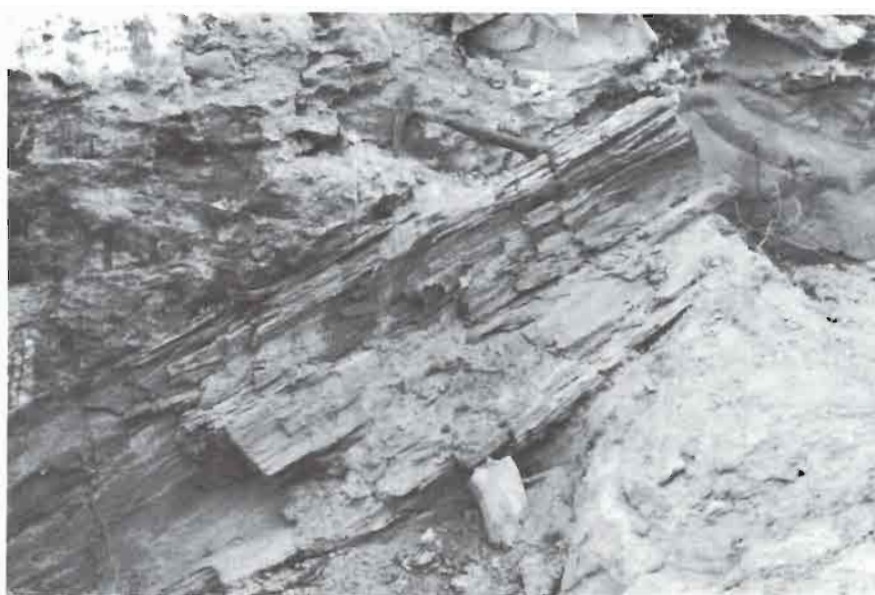
Foto 4: Aspecto parcial de un tronco fosilizado en la 2.ª Parada.