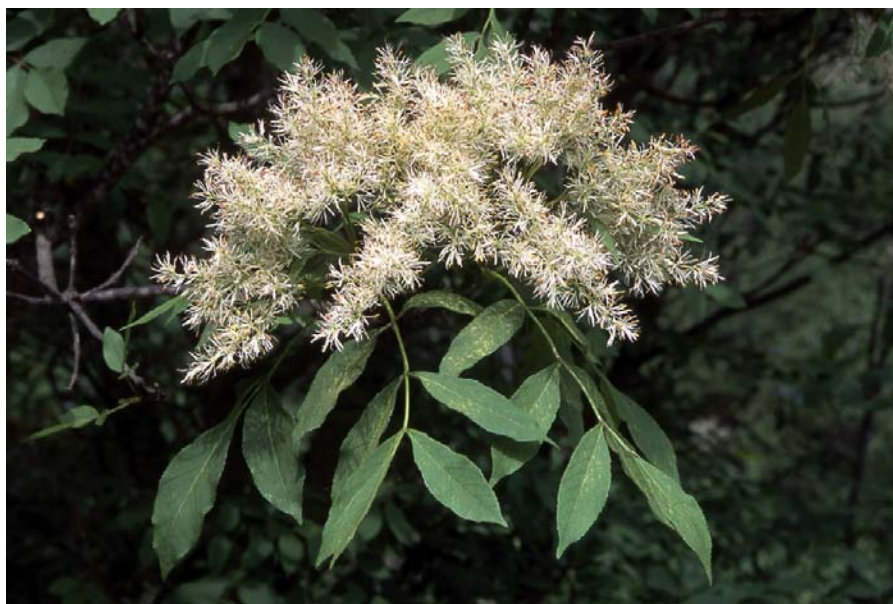
Figura 7. Fraxinus ornus.