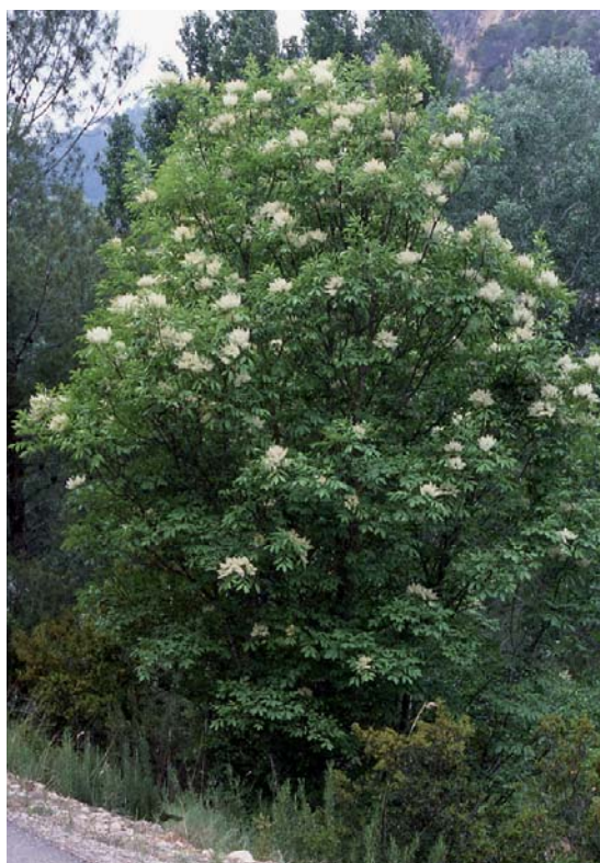
Figura 8. Fraxinus ornus.