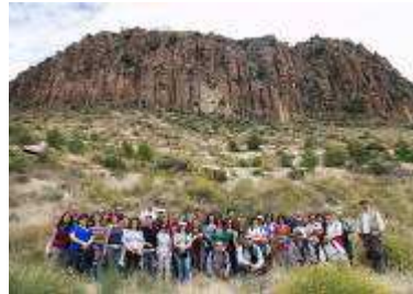
El volcán de Cancarix con el grupo participante en la excursión geológica

todo tipo de públicos sean cuales sean sus conocimientos previos de geología. Actualmente se celebra en todas las provincias españolas.