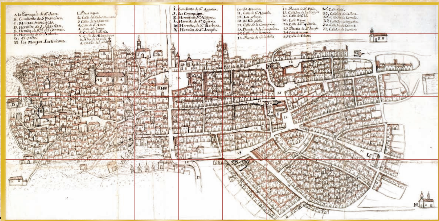
ALBACETE en 1767

Instituto de Estudios Albacetenses “Don Juan Manuel” de la Excm. Diputación de Albacete