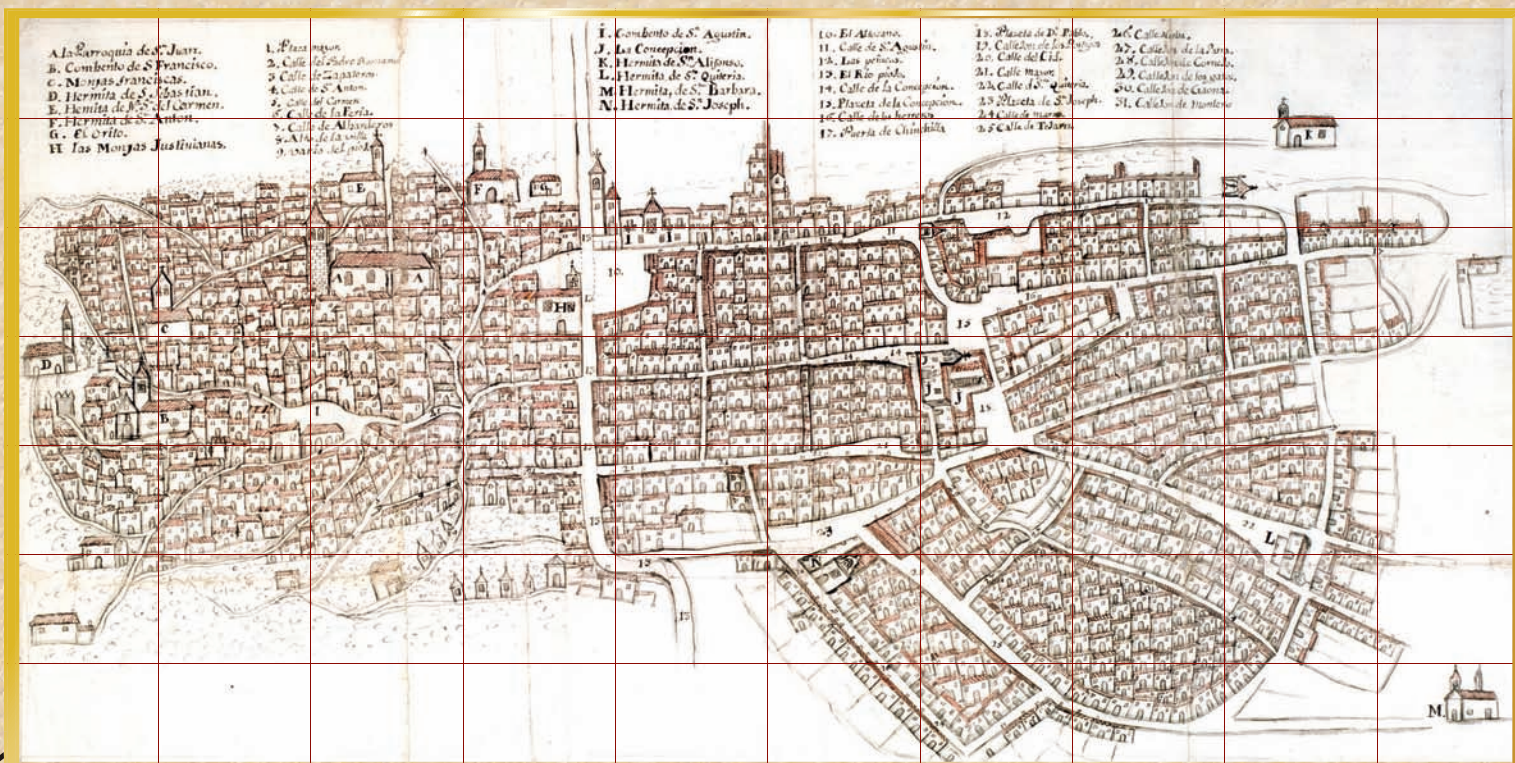
ALBACETE en 1767

Instituto de Estudios Albacetenses “Don Juan Manuel” de la Excm. Diputación de Albacete