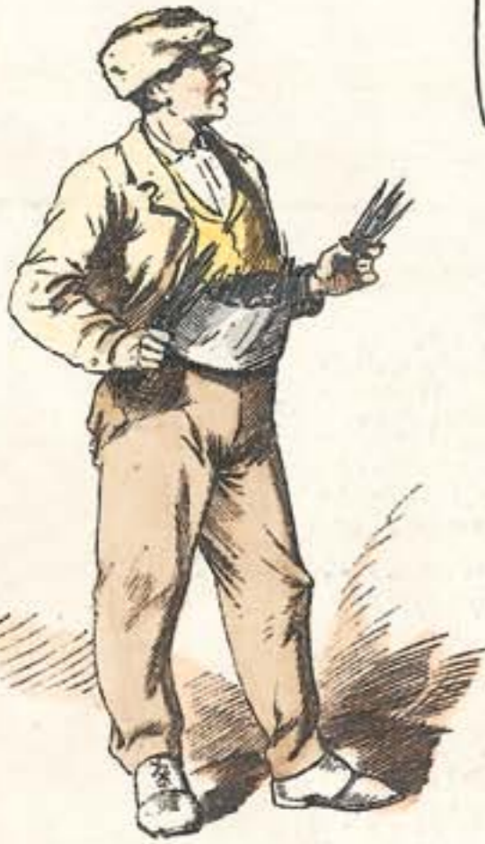
Navajas y puñales.