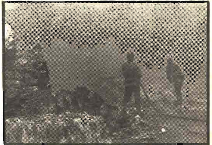
Los bomberos en acción. Una estampa que se repite todos los años por estas fechas.

viejo alumbrado de petróleo que precedió a la electricidad. (Ultima pág.)..