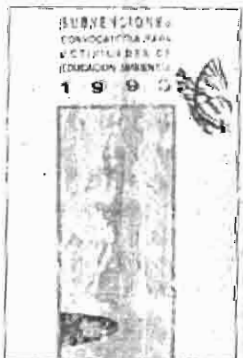
Subvenciones para educación

El plazo máximo de presentación de solicitudes finaliza el próximo día 6 de mayo a las 12 horas.