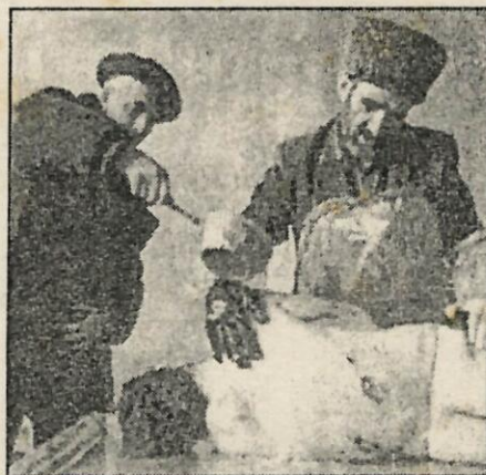
Dos hombres, ante el cadáver de un azerí.