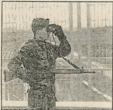
Soldados de reemplazo vigilan el AVE.