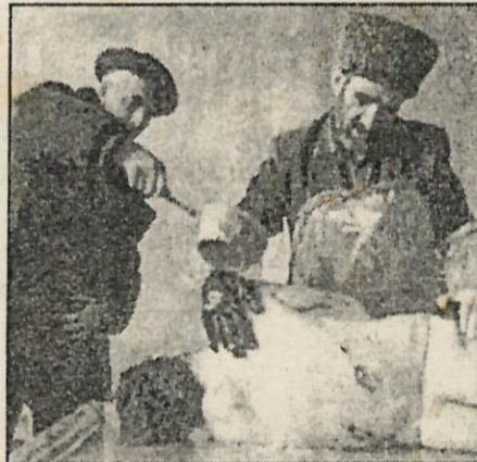
Dos hombres, ante el cadáver de un azerí.