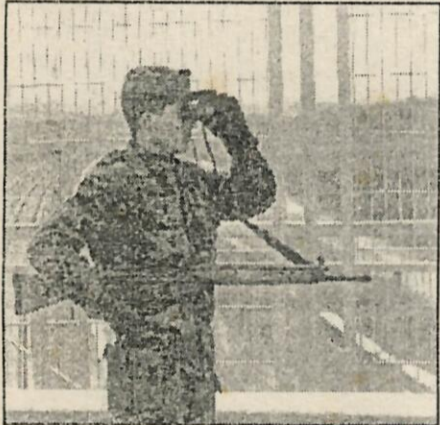
Soldados de reemplazo vigilan el AVE.