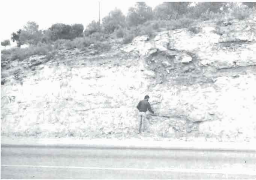
Foto n.º 3: Fallas normales en los materiales liásicos de la carretera de Balazote al Jardín.