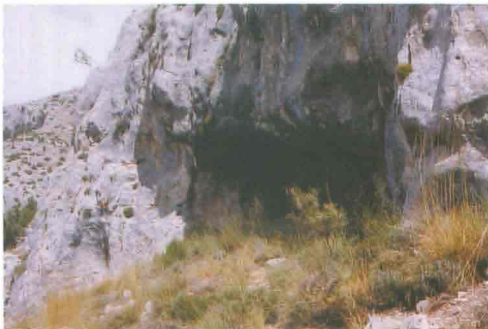
Figura 3. Vista general del abrigo de Arroyo Blanco I.