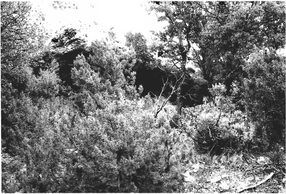
Figura 2. Abrigo del Cortijo de Sorbas III.