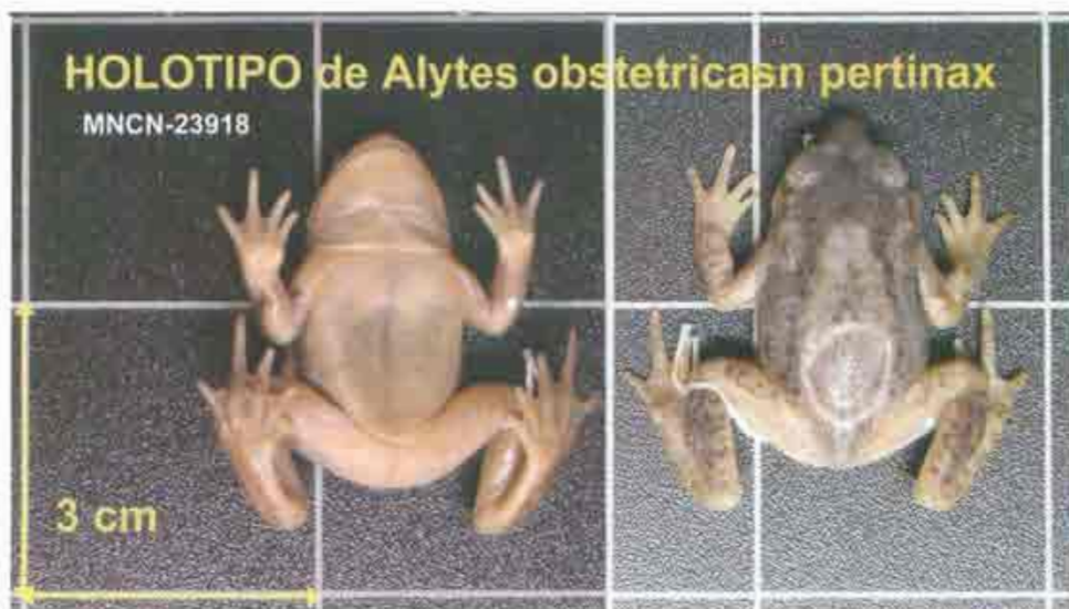
Fotografía 1 Holotipo de Alytes obstetricans pertinax García-Paris y Martínez-Solano, 2000