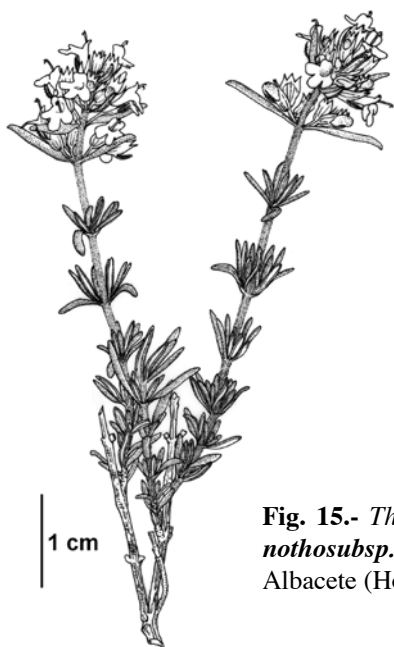
Fig. 15.- Thymus × monrealensis nothosubsp. peris-gisbertii , nothosubsp. nov. , Alborea ( pr. Corral de Lucas Miguel), Albacete (Holótipo) ALBA 6962): Hábito.