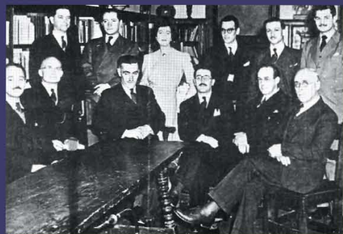
Hispanic Institute of Columbia University, New York, N.Y., 1942

Colaboró también en numerosas revistas a lo largo de su carrera.