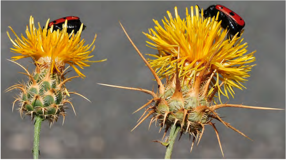
Figura 4. Centaurea gabrielis-blancae (izquierda) y C. ornata (derecha). Vista comparativa de un capítulo.