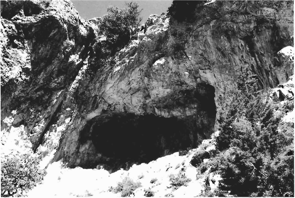
Figura 8. Abrigo del Barranco de los Buitres.