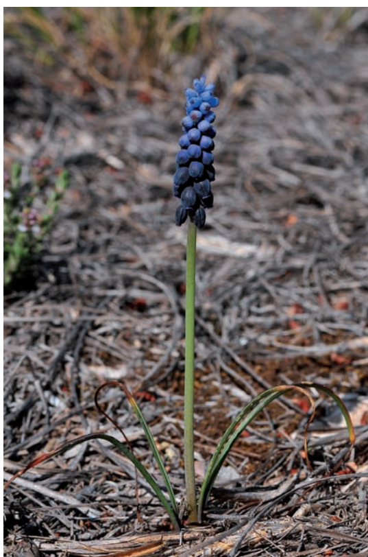
Fig. 12. Muscari atlanticum.