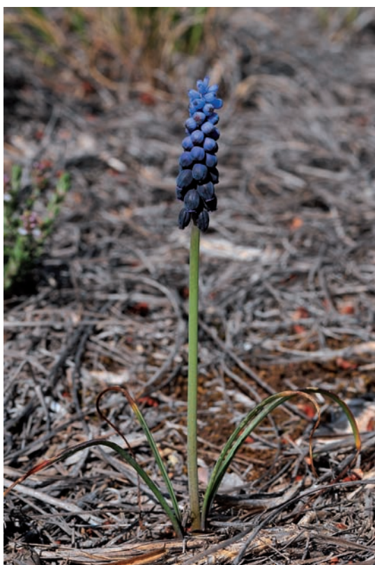
Fig. 12. Muscari atlanticum.