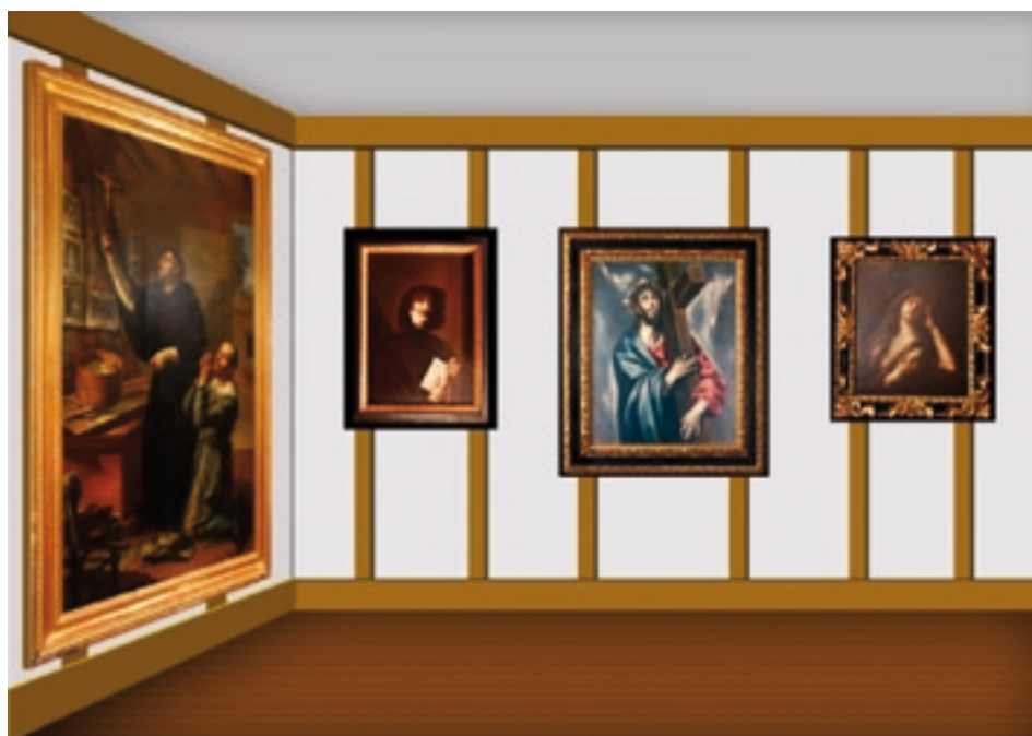
Imagen 5. Recreación virtual del Museo Parroquial de El Bonillo, donde está expuesto el cuadro, junto al de "La Magdalena" atribuido a Andrea Sarto, un "San Francisco", copia de José Ribera "El Españolito", y "El Milagro" de Vicente López. -.Recreación: Luis David Carrión García.