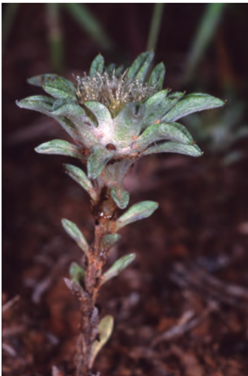
Figura 12. Filago carpetana . Vista superior del hábito.