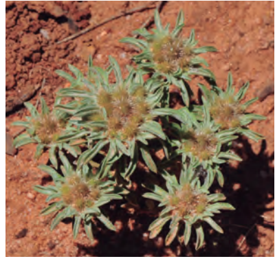
Figura 11. Filago carpetana . Vista cenital de un ejemplar ramificado.