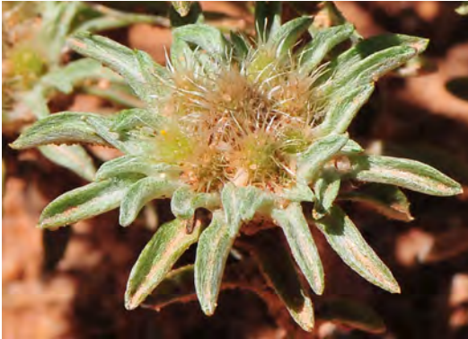
Figura 10. Filago carpetana. Detalle de un glomérulo.