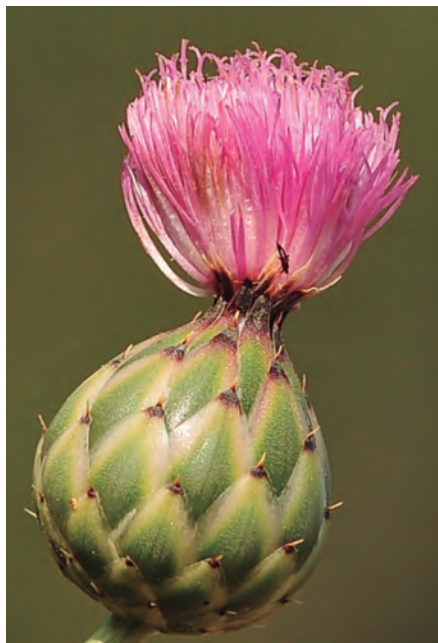
Figura 16. Mantisalca duriaei . Detalle de un capítulo.