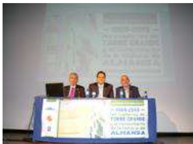
Presidencia de la Asamblea de la Asociación Torre Grande de Almansa a principios del 2013.