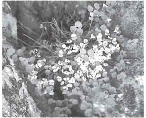
Foto 4. Sarcocapnos baetica ssp. baetica .