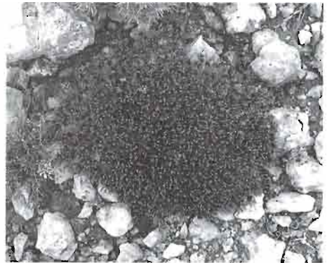
Foto 6. Thymus funkii ssp. funkii .