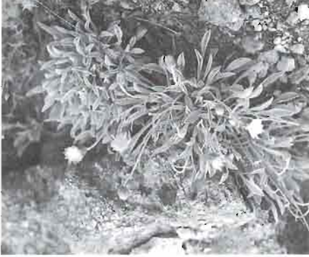
Foto 1. Andryala agardhii .