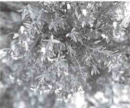
Foto 5. Teucrium rivas-martinezii .