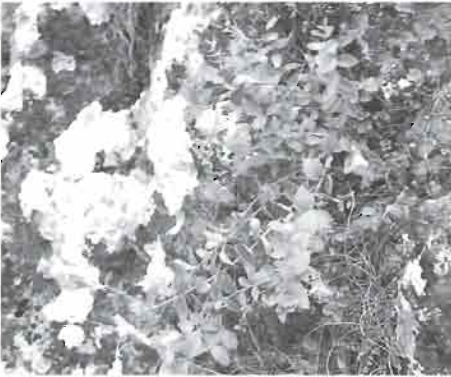
Foto 3. Linaria cavanillesii .