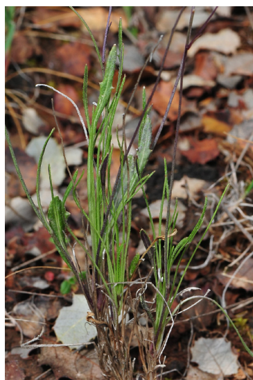
Figura 11. Biscutella leptophylla . Detalle de las hojas en la base de los tallos.