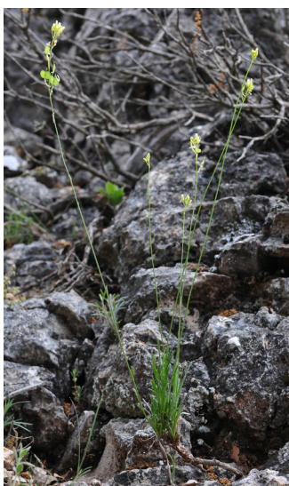
Figura 10. Biscutella leptophylla. Hábito.