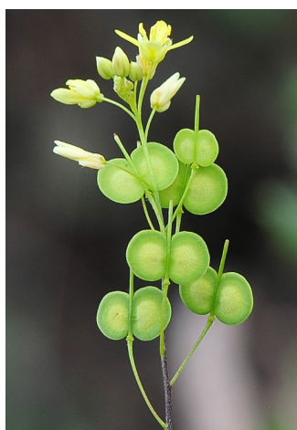
Figura 12. Biscutella leptophylla . Detalle.