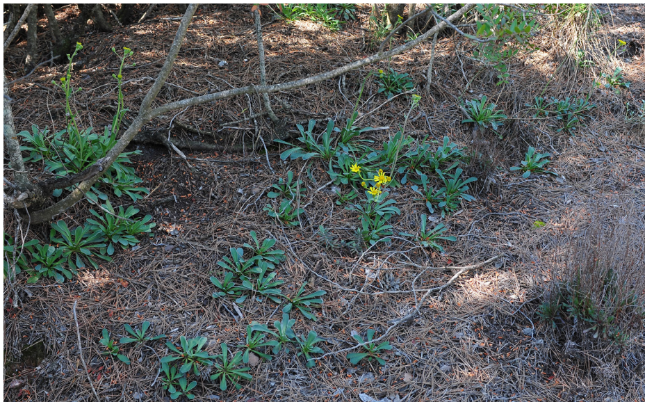
Figura 18. Jacobaea auricula . Detalle de la nueva población encontrada.

J. (1990); Pelsler, P. B. et al. (2006) y (2007); Salmerón, E. et al. (2017); Sánchez Gómez, P. et al. (1997); Valdés, A. y Gómez, J. (2018); Valdés, A. et al. (1993); VV.AA. (2000); Willkomm, M. (1893).