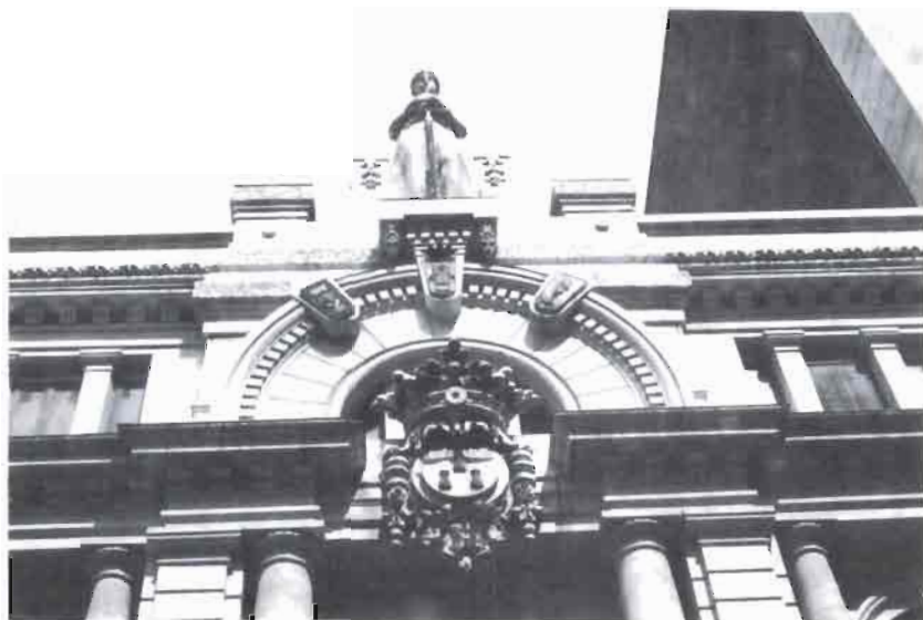
COLEGIO NOTARIAL (Detalle)