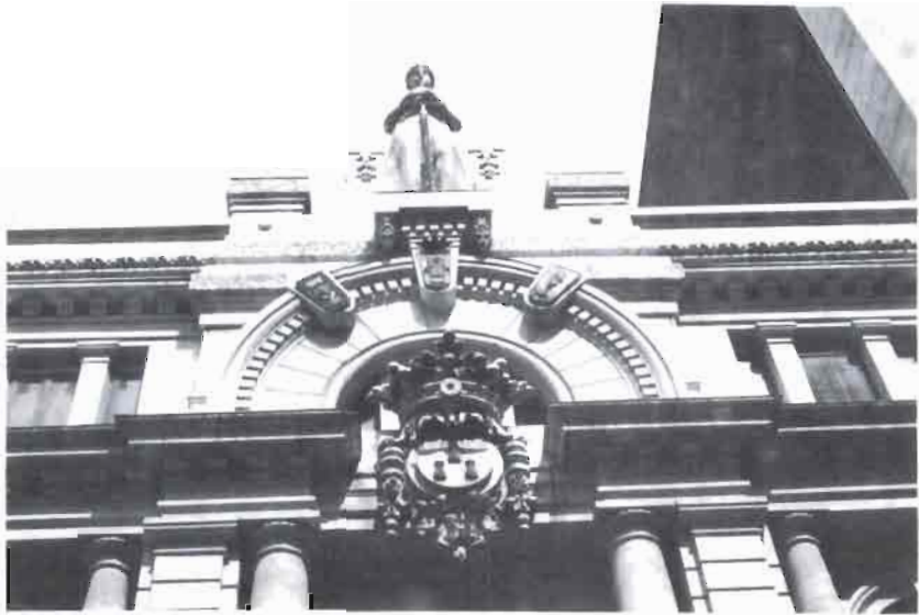
COLEGIO NOTARIAL (Detalle)