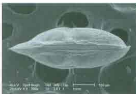
Fotografías 23 y 24. Vista dorsal de un macho de Paralimnocythere messanae (izquierda) y vista dorsal de una hembra de esta misma especie (derecha).

Paralimnocythere messanae , (foto 23 y 24) es una especie que hasta hace pocos años no había sido descubierta (Martens, 1992), pero que es bastante frecuente en riachuelos y fuentes (Mezquita, 1998; Mezquita y cols., 2001). En este estudio P. messanae es una de las especies mejor representada como se ve en la figura 5.