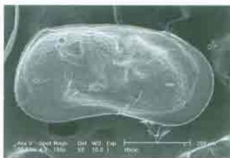
Fotografías 21 y 22. Vista dorsal de Darwinula stevensoni (izquierda) y vista interna de la valva izquierda de Limnocythere inopinata (derecha) donde podemos observar unas pequeñas espinas características de esta especie en la parte posterior de la valva.