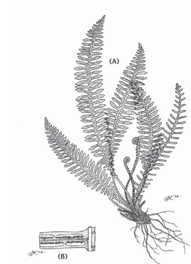
Figura 26. Aspecto de los individuos de la especie (A) y detalle de las pinnas (B). Román Belmonte.