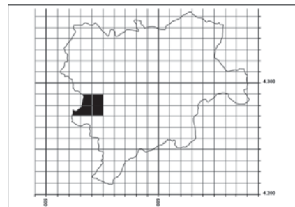
Figura 31. Distribución de Cheilanthes hispanica en la provincia de Albacete.