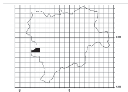
Figura 41. Distribución de Cystopteris fragilis en la provincia de Albacete.