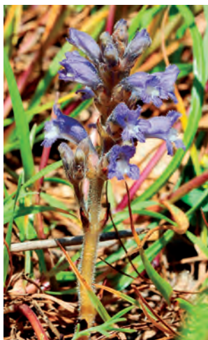
Fig. 20. Phelipanche nana . Hábito.