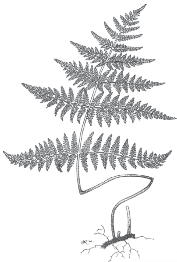
Figura 66. Aspecto de los individuos de la especie (A) y del esporangio con las células del anillo de dehiscencia (B). Román Belmonte.