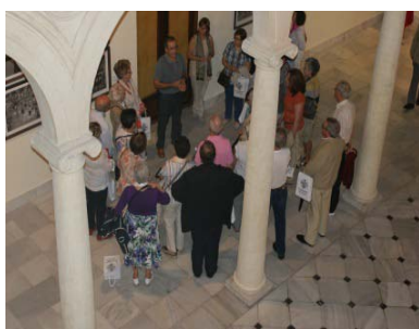
Alumnos de la universidad de la experiencia visitan el Instituto de Estudios Albacetenses.

Cada Departamento de la Comisión Permanente se ocupa de una hora, el primer y tercer jueves de cada mes de 19 a 20 horas en la Sala de Juntas del Centro Cultural de la Asunción SEDE DEL IEA.