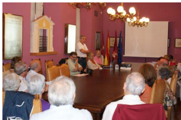
El cuarto curso de la promoción de los alumnos de la Universidad de la Experiencia en la sala de juntas del Instituto de Estudios Albacetenses el día de la inauguración de las Conversaciones .

Dirigido a los alumnos de cuarto curso de la Universidad de la Experiencia, el curso comenzó en octubre de 2013. La organización corre a cargo de la UP-Ayto de Albacete y del IEA que pone instalaciones y conferenciantes. Son 28 los alumnos asistentes a este curso que obtendrán un certificado final del mismo. En cada clase se les facilitará un libro publicado por el IEA cercano al ámbito del tema tratado ese día.