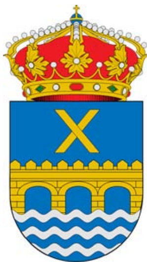
Escudo de Alcalá del Júcar

Por tal motivo el Ayuntamiento de Alcalá del Júcar ha solicitado la colaboración del Instituto de Estudios Albacetenses para conmemorar esta efeméride.