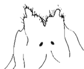
Genitalia ♀ P. spiniger