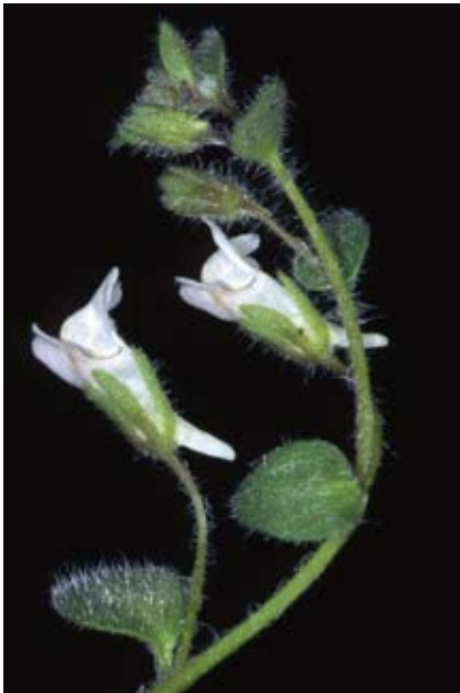
Fig. 4. Chaenorhinum tenellum

http://www.ua.es/es/informacion/biodiversidad/cuadbiod03.pdf