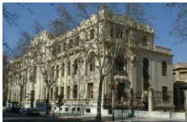
IES Bachiller Sabuco de Albacete

La mayoría de estos centros han conocido alguna publicación del IEA, ya que han participado en las campañas de difusión de muchas de los trabajos de investigación sobre Albacete para formar parte de sus bibliotecas.