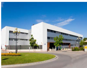
IES número 15 (Alto de los Molinos) de Albacete

Sin embargo, en esta ocasión el IEA pretende llegar a los alumnos, a los futuros investigadores de todos los ámbitos de las ciencias y las humanidades o las artes para que tengan referencias de primera mano de qué es el IEA, cómo se trabaja en su sede, qué tipo de documentos e información se puede consultar y cómo se puede acceder a él.